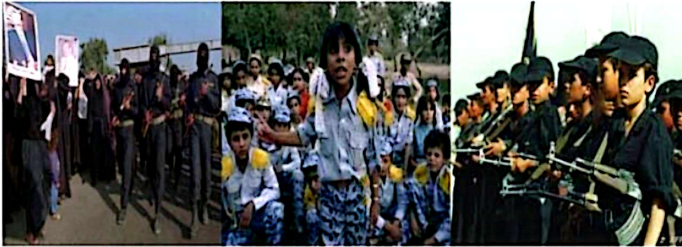
صورة (٢ - ٤) تبين تشكيلات (أشبال صدام، الطلائع، فدائيي صدام).

لقد أسهمت هذه السياسة في تحويل المجتمع إلى معسكر كبير للتدريب على حمل السلاح وتفعيل استعماله فيما جر الولايات على الشعب العراقي وشعوب المنطقة بما تحصل في حربي الخليج الأولى، والثانية، وحرب تغيير نظام البعث. وقد سلبت سياسات النظام - المتعلقة بعسكرة المجتمع - من ذلك المجتمع حقه في العيش الأمن المستقر والاستمتاع بحياة صحية آمنة وطويلة؛ ففي الوقت الذي كانت فيه شعوب المنطقة تعيش التنمية على المستويات كافة كان العراق غارقاً في دوامات الحرب والدمار.